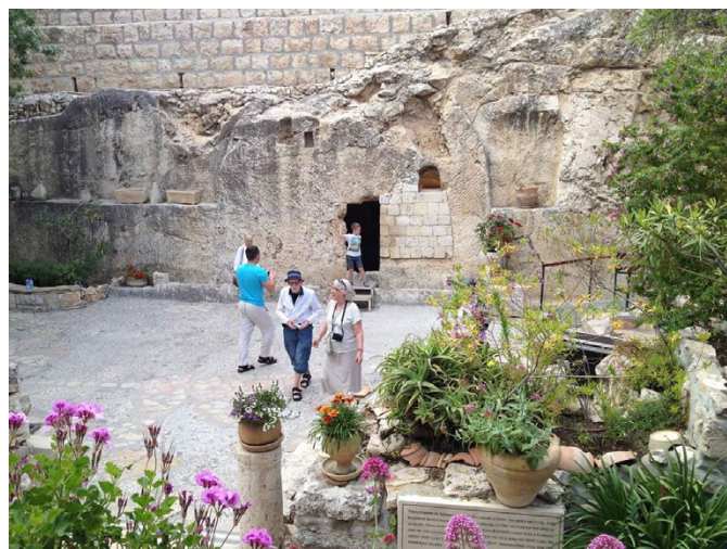
Ovan: Oskar och Irene vid trädgårdsgraven.