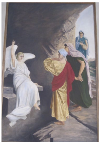
Altartavla i Långareds Kyrka