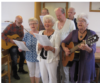
Lägrrets sånggrupp medverkade vid flera tillfällen under lägret.