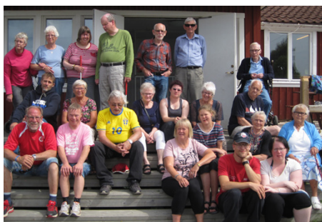
Gruppen från Timmele GOIF tillsammans med några läger-deltagare på trappan till Västkostgården.