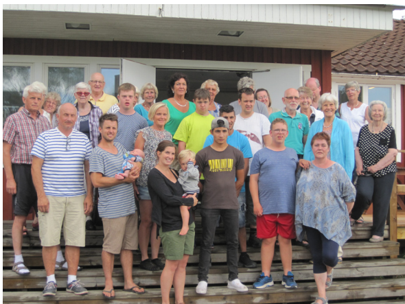
E-laget Långared BOIS samt några lägerdeltagare 2016

Tisdag: Olika aktiviteter. Bad och lek, Vandring i området m.m. Denna dag är E- laget Långared Bois inbjudna samt Timmele GIOS och några familjer. Det blir en dag med lek, bad, mat, gemenskap och annat roligt.