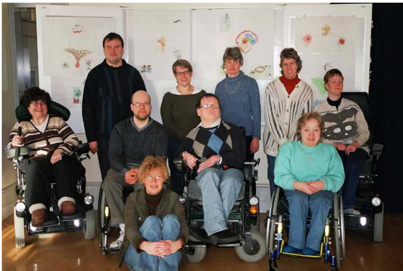
Gänget som gjorde Mättinge-helgen. Referat i tidningen.