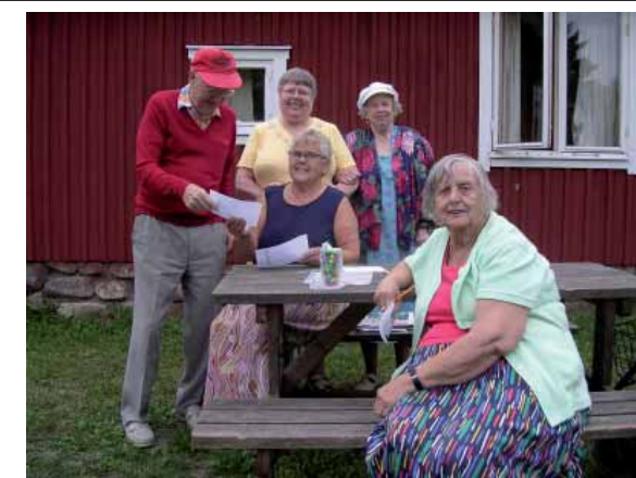
Deltagare vid Lerkilsdagarna 2006